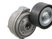
napenjalnik jermena kat. št.: 51.95800-7499 139,21 € kat. št.: 51.95800-7520 167,43 €