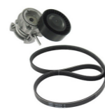
komplet napenjala jermena E6 kat. št.: 51.95800-6131 173,63 €

V času akcije lahko znatno prihranite pri nakupu originalnih na domestnih delov MAN – vse prednosti in zmanjšani stroški se vam bodo poplačali.