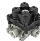
4-krožni varnostni ventil kat. št.: 81.52151-6098 117,09 €