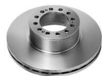
zavorni kolut 22,5" kat. št.: 81.50803-0040 151,22 € kat. št.: 81.50803-0041 156,78 €

Zanesljivo zaviranje je temelj varne in udobne vožnje. Originalni deli MAN zagotavljajo popolno prileganje in optimalen prenos sil.