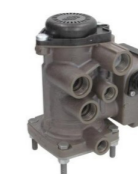
krmilni ventil prikolice WEPI kat. št.: 81.52301-9213 649,30 €