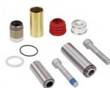
komp. za popr. kolutne zavore kat. št.: 81.50822-6044 122,44 €