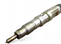
injektor kat. št.: 51.10100-9191 360,09 € kat. št.: 51.10100-9180 344,46 €