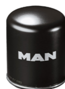
vložek sušilnika kat. št.: 81.61910-6053 97,03 €