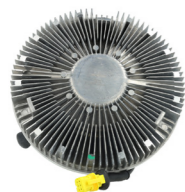
sklopka ventilatorja kat. št.: 51.06630-0141 787,91 € kat. št.: 51.06630-0140 780,62 €