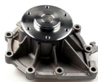
črpalka hlad. sredstva kat. št.: 51.06500-6694 434,09 €