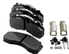
obloge kolutne zavore kat. št.: 81.50820-6091 149,40 € kat. št.: 81.50820-6107 138,82 €