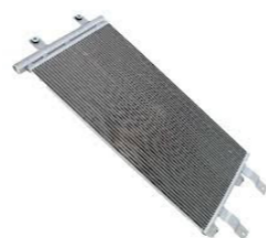
kondenz. hladilnega sredstva kat. št.: 81.61920-6041 273,59 €