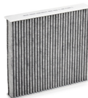
filter za pelod kat. št.: 65.61910-0001 19,68 €