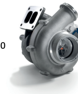
turbopuhalo na izpušne pline kat. št.: 51.09101-9230 962,44 €

Originalne turbine MAN zagotavljajo optimalno zmogljivost, nižjo porabo goriva in daljšo življenjsko dobo motorja.