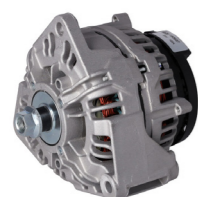
alternator kat. št.: 51.26101-9283 346,85 €