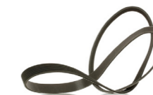
narebreni klinasti jermen 8PK1275/28,28 8PK1920/28,28 kat. št.: 51.96820-0243 41,13 € kat. št.: 51.96820-0345 44,00 €